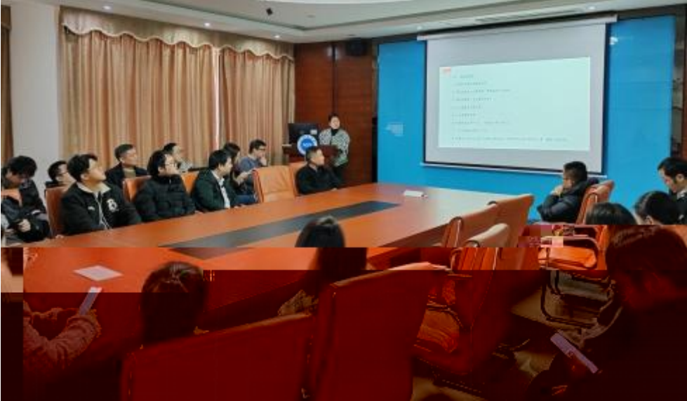
图 员工专业技 培