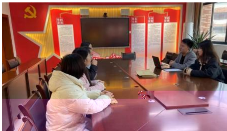
图 企开展学术 交 会