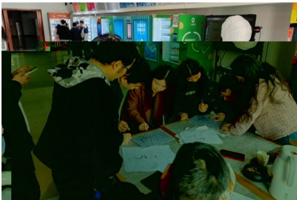
图 卓 团 建 共