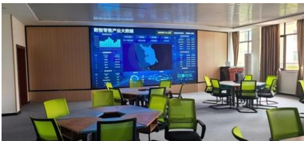
图 智慧 售 中心