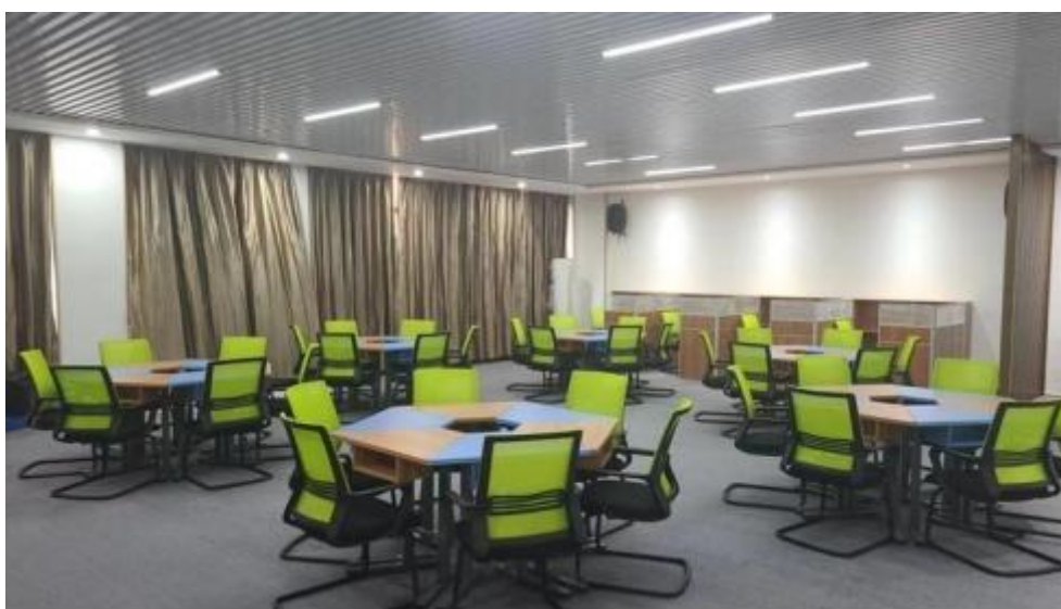
图 智慧 售 中心